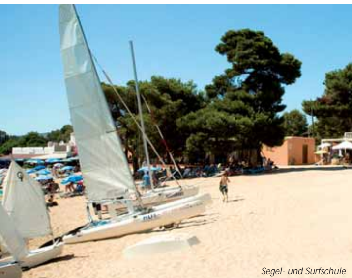
Segel- und Surfschule

Das CLUB CALA PADA Abendshowprogramm bietet im 14-tägigen Wechsel ein abwechslungsreiches, unterhaltendes und spannendes Programm. Unsere Produktionen bieten echtes Live-Entertainment mit Herz. Der perfekte Ausklang eines Urlaubstages an der CLUB CALA PADA Showbühne.