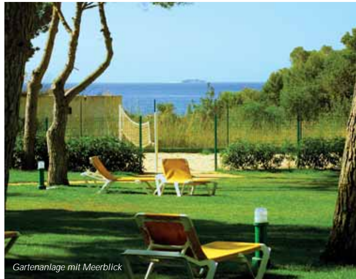
Gartenanlage mit Meerblick