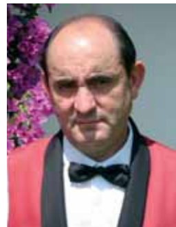
Benito Tribaldos (Restaurant)