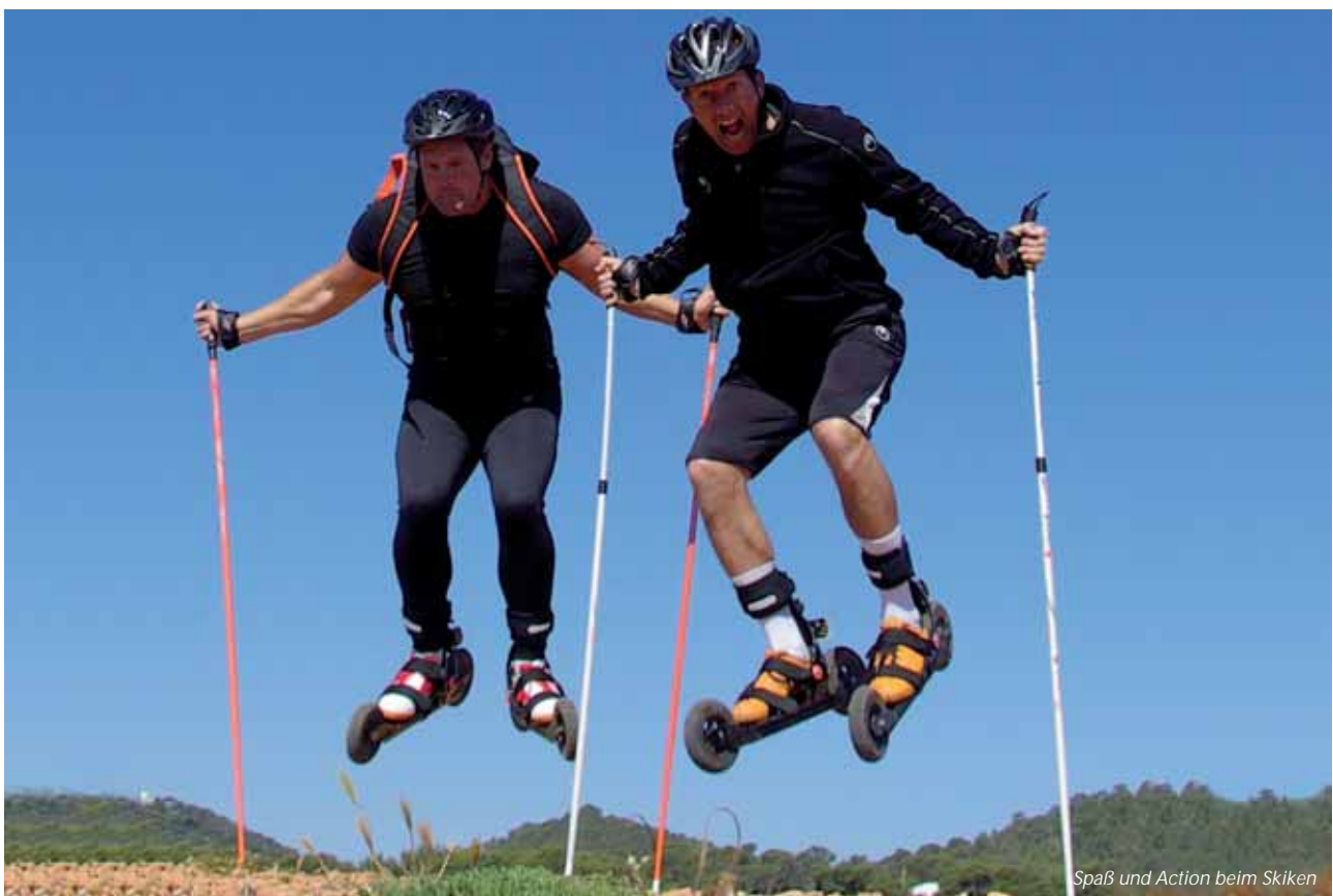
Spaß und Action beim Skiken

An den Terrassentüren der Apartments (Parterre) haben wir Eisenstifte angebracht, die ein unbefugtes Aufschieben der Terrassentür von außen verhindern. Bitte nutzen Sie diese Sicherheitsvorkehrung. An verschiedenen Stellen im Club sind zusätzlich Überwachungskameras installiert. Während der Abend- und Nachtstunden ist ein externer Sicherheitsdienst vor Ort. Sollten Sie auffällige Personen im Club bemerken, informieren Sie bitte umgehend die Rezeption (Telefonnummer 9). Herzlichen Dank!