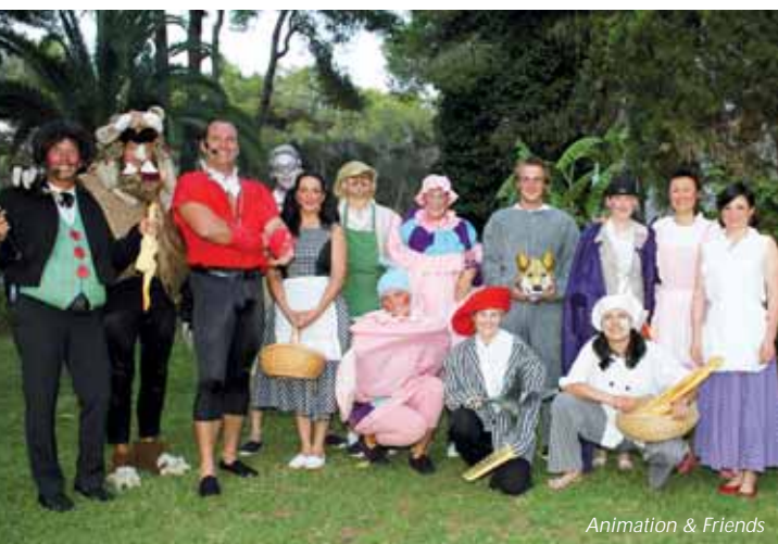
Animation & Friends

Das bekannte Broadwaymusical in der CLUB CALA