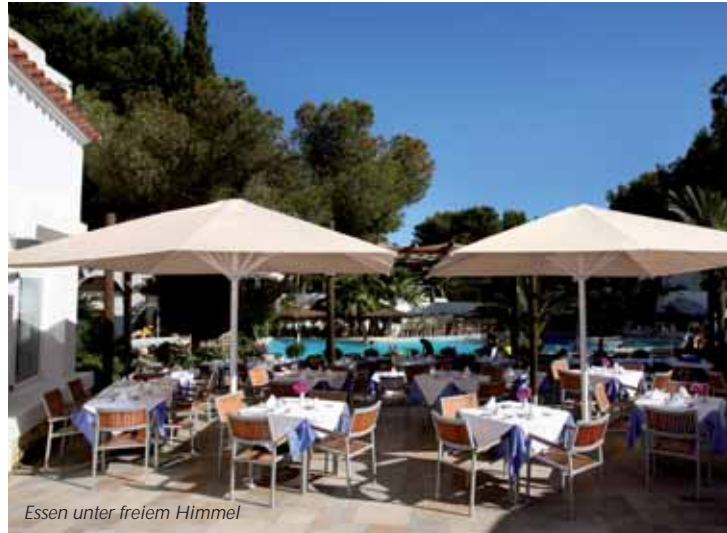
Essen unter freiem Himmel