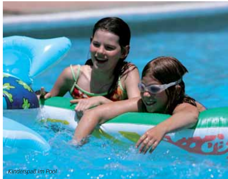
Kinderspaß im Pool

Kosmetikerin und Wellnessmasseurin Lea verwöhnt Sie mit diversen Spa-Behandlungen in unserem gemütlichen Beautysalon. Detaillierte Informationen erhalten Sie direkt bei Lea im Beauty Salon neben der Boutique. Gegen Vorlage des Gutscheins aus unserem Gutscheinheft erhalten Sie spezielle Preisvorteile.