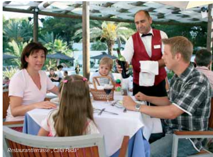
Restaurantterrasse „Cala Pada“

sind während des Mittag- und Abendessens inkludiert. Neben unserem umfangreichen Frühstücksbuffet bietet unser Küchenteam in dieser Saison täglich frische Früchte, Tomatensaft, Müsli und Vollkornprodukte in unserer neuen Fitness-Ecke. Neben den wechselnden Themenabenden finden Sie abends täglich einen speziellen Bereich mit typisch spanischen Leckereien. Wir bitten, während des Abendessens sportlich elegante Kleidung zu tragen und die Herren auf Sport-Shorts sowie ärmellose Hemden zu verzichten. Das Betreten des Restaurants in Schwimmkleidung oder barfuß ist nicht gestattet. Ferner bitten wir Sie, Speisen und Getränke nicht aus unseren Restaurants mitzunehmen.